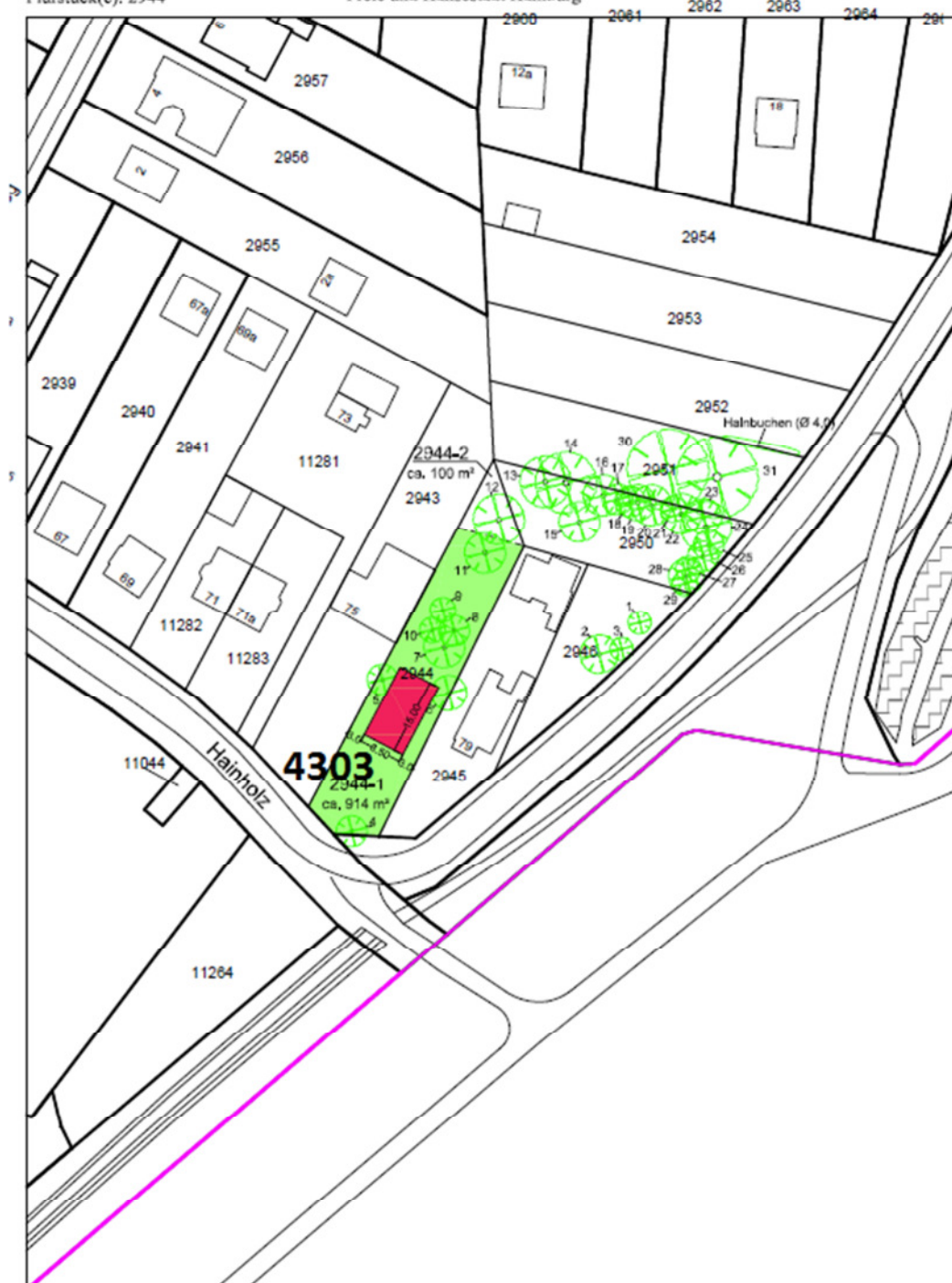
Karte ist nach Norden ausgerichtet.

Immobilienmanagement Grundstücksinformation und Vermessung Bearbeiter/m: R.T.